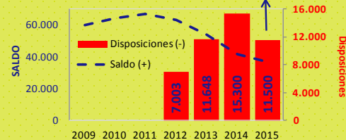
Fondo de Reserva 2009 - 2015

Fuente: Seguridad Social, diciembre 2015