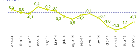
Evolución anual del IPC Base 2011

La inflación anual estimada del IPC en marzo de 2015 es del -0,7%, cuatro décimas más que en febrero (-1,1%), principalmente, por la subida de los precios de los carburantes (gasoil y gasolina).