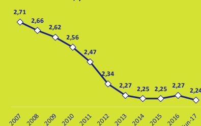
Evolución afiliados / pensionistas